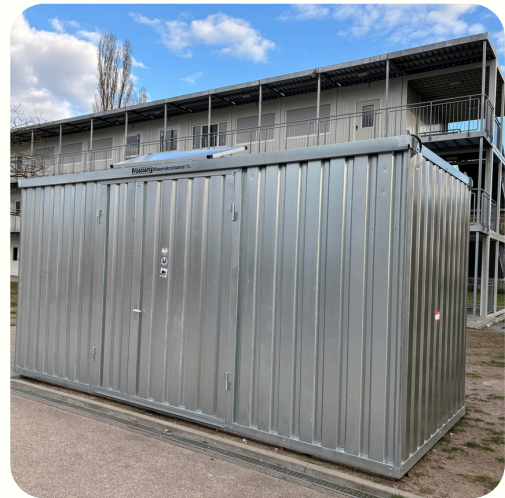
Dieser Container beherbergt das Pausenspielzeug, denn die alte Unterbringung entsprach nicht dem Feuerschutz

Obwohl unklar ist, wie lange der aktuelle Schulhof bestehen bleibt, möchte der Förderverein die Pausenatmosphäre verbessern, zusätzlich zum Mentorenprojekt, welches wir im letzten Newsletter vorgestellt haben. Eine Freundschaftsbank auf dem Schulhof fördert soziale Interaktionen und hilft einsamen Schülern, Kontakte zu knüpfen. Ein Schüler, der auf der Bank sitzt, signalisiert Gesprächsbereitschaft, was Ausgrenzung verringert. Die Bank stärkt das Gemeinschaftsgefühl und unterstützt ein freundliches Schulumfeld.